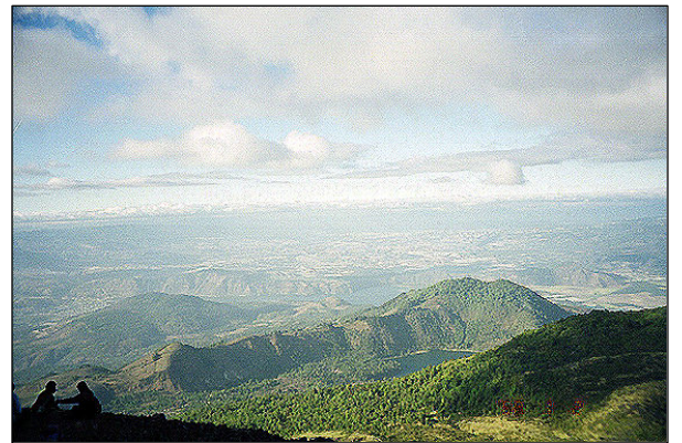
Blick vom Pacaya